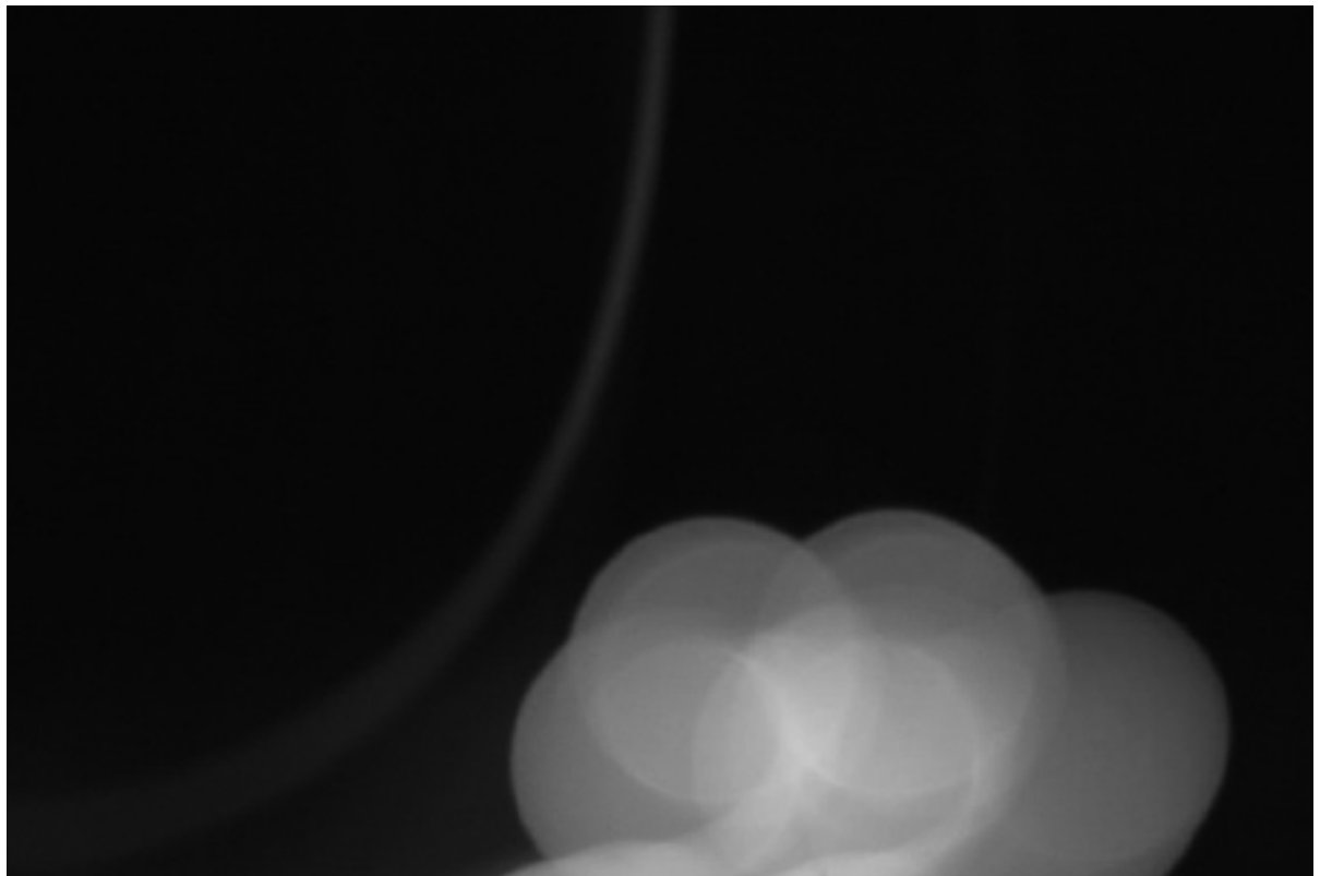
"Me-1/2" (90 x 135 cm.) per Laura Marte. Impressió digital / dibond. Any 2009

"El límit com a punt de partida" es presenta amb obres reproduïdes digitalment i muntades sobre alumini.